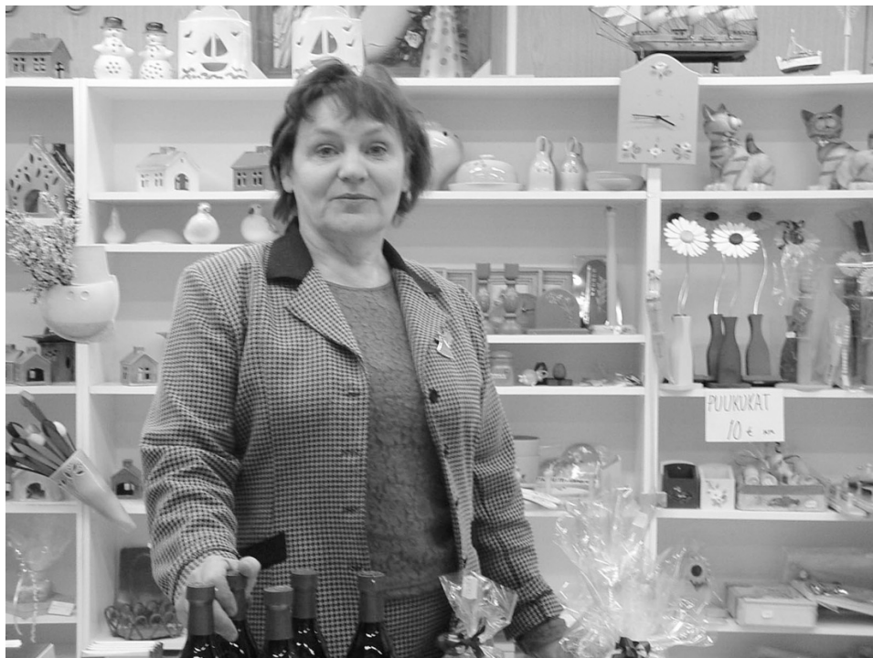
Katruusa on vuosikymmenien aikana muuttunut monipuoliseksi lahjatavaliikkeeksi.

Liikkeessä panostetaan laatuun. Katruusassa pyritään tuomaan esille erityisesti suomalaista ja oman maan tuotteita. Esillä on paljon paikallisten yksityisten ihmisten valmistamia käsitöitä. Liikkeessä on muun muassa posliini-, neulonta-, kudonta-, virkkaus-, sekä puutöitä. Lisäksi myytävänä on lähialueen keramiikkapajojen ja takomien valmistamia tuotteita sekä leluja. Lahjatavarat ovatkin ehkä