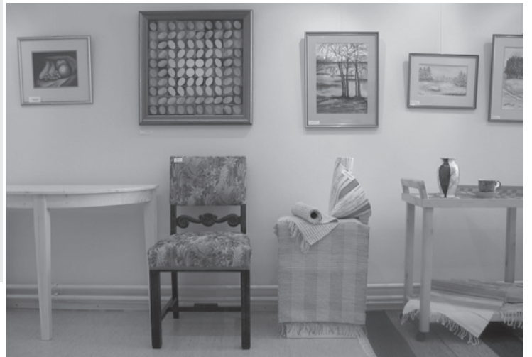
Raahe-opiston kevätnäyttely oli läpileikkaus Pyhäjoen opintopiireissä tehdyistä upeista harrastetöistä. Opiston kevätinäyttely on aina vuoden suosituimpia näyttelyjä ja kerää reilun viikon aikana kolmisen sataa kävijää. Tällä viikolla kirjaston näyttelytilassa voi tutustua koulun kevätinäyttelyyn; esillä on Pyhäjoen yläasteen kuvataiteen töitä.