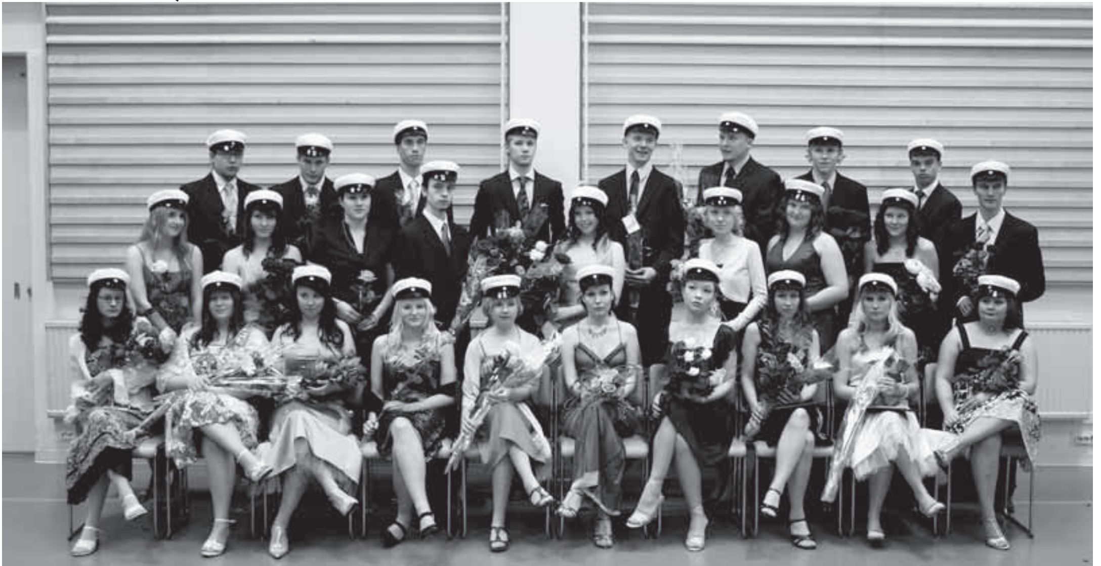
Kauniina kesäpäivänä valmistui Pyhäjoen lukiosta 27 uutta ylioppilasta. Lisää ylioppilasjuhlasta lukion sivuilla.