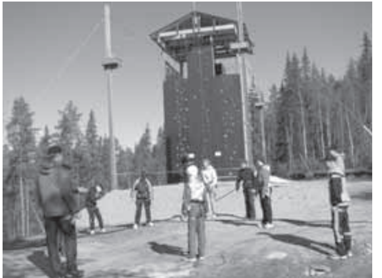
Kiipeilytorni Mount Karhu näytti aluksi pelottavan korkealta, mutta kaikki valloittivat sen helposti.