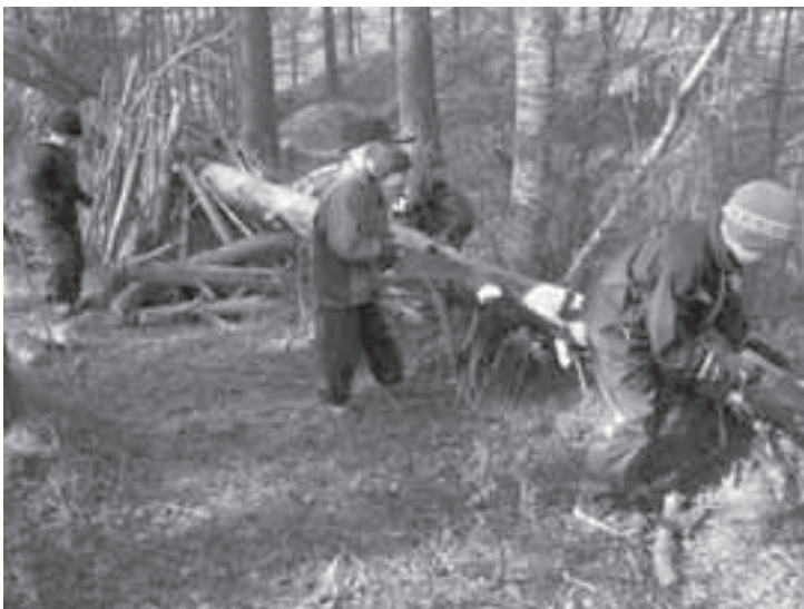
Majanrakennus sujui eka ja tokaluokkalaisten yhteistyönä.