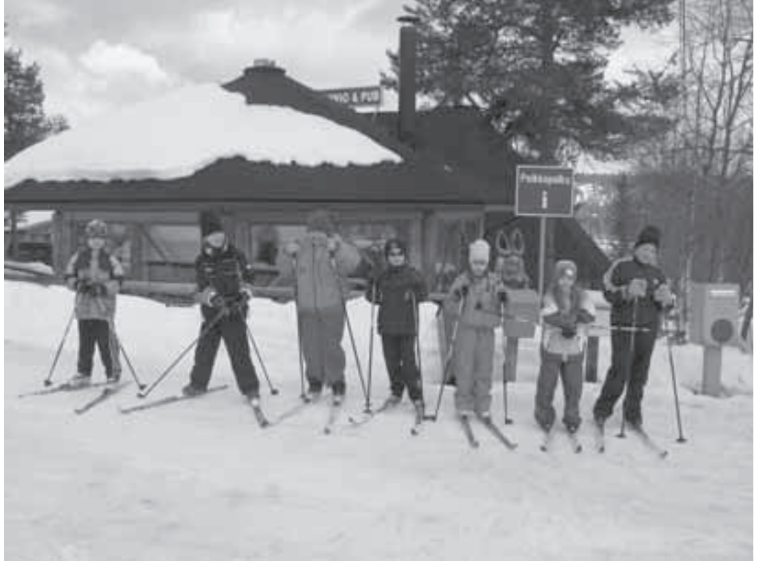
Oppilaat lähdössä hiihtoretelle.