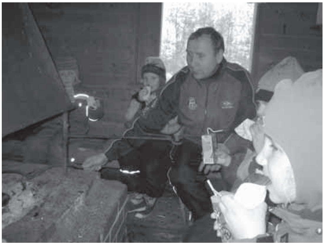
Makkara maistui hiihtoretken jälkeen Ristivuorella.