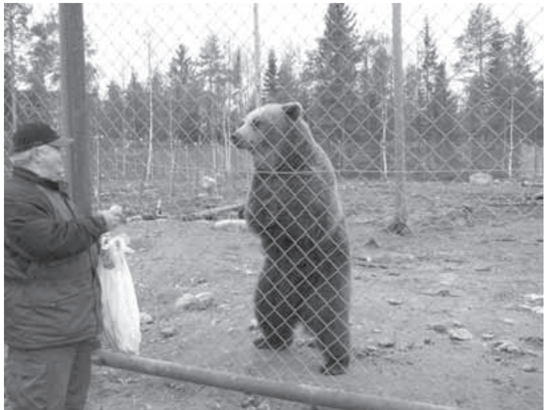
Sulo ja suloisten pentujen isä Vyöti-karhu esittelivät osaamistaan