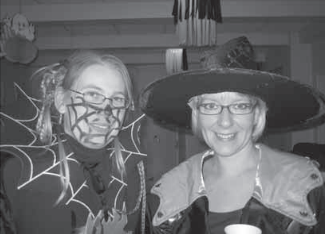
Nämä kaunottaret järjestivät hurrirjat Halloween-juhlata.