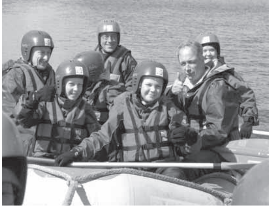
Koskenlasku safari oli mahtava kokemus. Aurinko paistoi, ja kaikki olivat tyytyväisiä pienistä haavereista huolimatta.