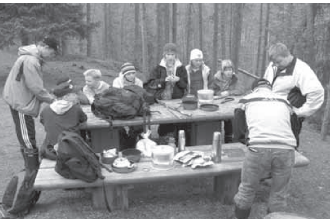
Kiutaköngään vaelluksella ruoan laittaminen maastossa oli mukavaa ja yhteistyötä vaativaa puuhaa.

Kun saavuimme takaisin ruokapaikalle, aloitimme ruuanlaittamisen trangiolla. Tehtiin riistapataa, kana-riisi-sienipataa ja metsästäjän pataa. Kaikki ruoat olivat yllättävän maistuvia, liekö meillä vain ollut niin nälkä. Jälkiruoaksi jotkut vielä paistoivat