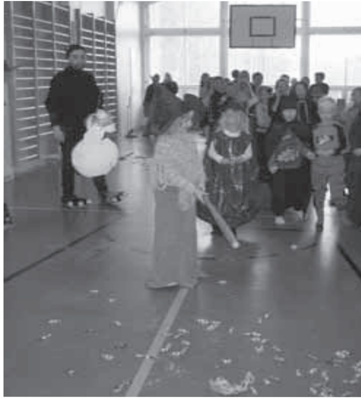
Piniatan rikkomisen vaati monta iskua.

Kaikkea ei kuitenkaan ehdi. Omalta osaltani olen jotenkin huono omaantuntoa monestakin asiasta, muun muassa siitä, että en kovinkaan usein ole ehtinyt ulkovalvontaan. Mutta siltä osin asiat ovat luistaneet mallikkaasti, sillä koulumme pihatarjoaivat harrastamismahdollisuudet oppilaille, ja niin turha nahinointi on unohtunut. Sopuisaan ulkotouhuiluun luokin jo hyvän pohjan koulun yhteydessä oleva ryhmäperhepäiväkotit Puuhala, jonka henkilökunta ohjaa lapsia pienestä pitäen yhteisiin leikkeihin sääntöjä noudattaen. Tästä jatkaa sitten esikoulu. Yhdessä kun pihalla touhuillaan, niin pienet ja isot tutustuvat toisiinsa ja uudet ikäluokat pääsevät hyvin mukaan kouluyhteisöön.