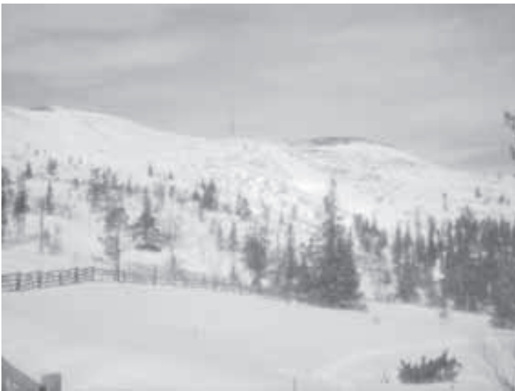
Pyhäjoen ylä-asteen 9. luokkien pohjoinen leirikoulu suuntautui Levin hienoihin maisemiin. Leirikouluun osallistui 13 oppilasta ja yksi valvoja. Menomatalla tutustuimme Oulun Tietomaahan. Majapaikkana oli reilun kokoinen mökki Levillä. Tiistai ja keskiviikko päivät vietimme laskettelurinteessä auringon paisteessa. Tiistai-iltana vierailimme Huskytilalla. Viimeisenä leirikoulupäivänä kävimme Rovaniemellä Arktikumissa sekä Lapin Urheilupistolla kiipeilemässä. Leirikoulu sujui hyvin.

matematiikka, fysiikka ranska oppilaanohjaus, matematiikka englanti, ruotsi matematiikka, fysiikka, kemia, atk atk, fysiikka biologia, maantieto, terveystieto historia saksa, syventävä kieli englanti, ruotsi kemia liikunta (pojat), terveystieto erityisopetus kotitalous, yrittäjäyys liikunta (tytöt) historia, yhteiskuntaoppi, uskonto musiikki äidinkieli matematiikka, fysiikka, kemia äidinkieli tekninen työ, matematiikka tekstiilityö erityisopetus kuvataide