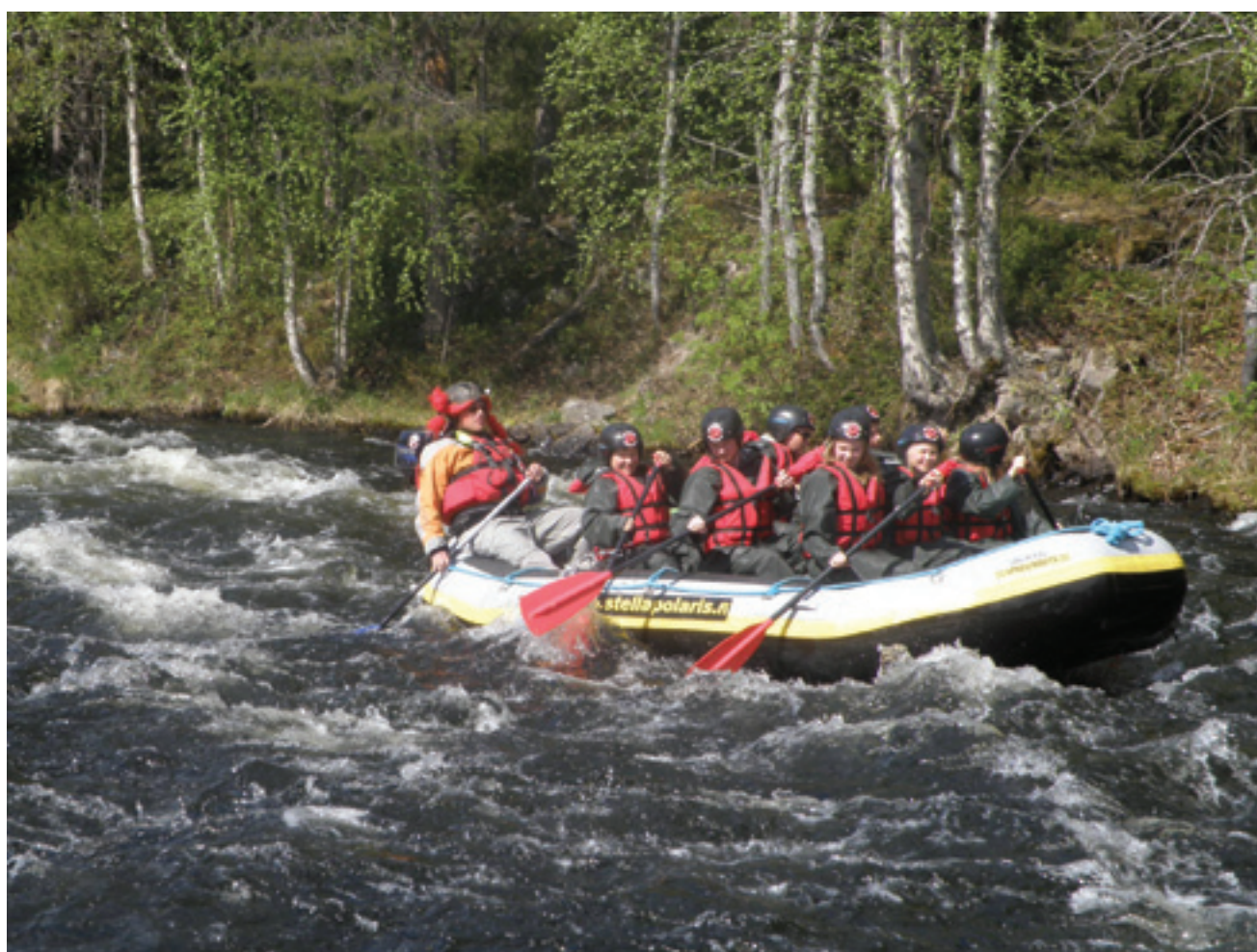
Leirikoululaisia Käyläjoen kosken kuohuissa.

Me Parhalahden kuudesluokkalaisten teimme leirikoulun Nuorisokeskus Oivankiin Kuusamoon. Me olimme siellä maanantaista torstaihin vi-