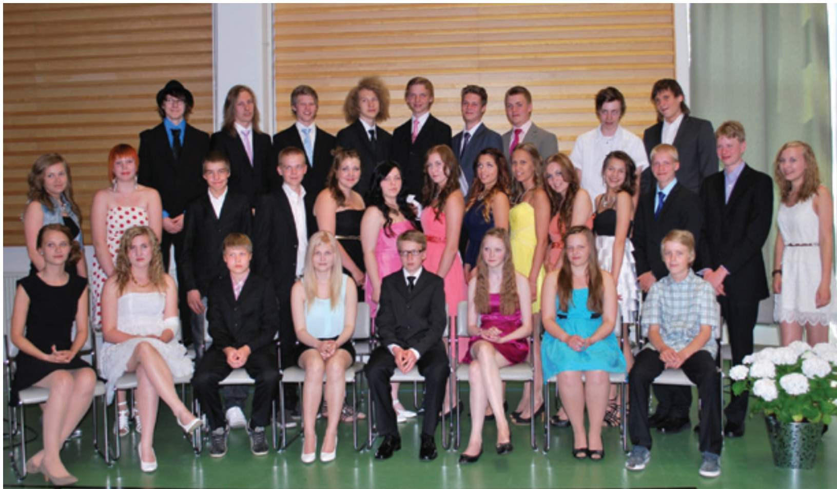
Päättötodistuksen saaneet 9. luokkalaisten