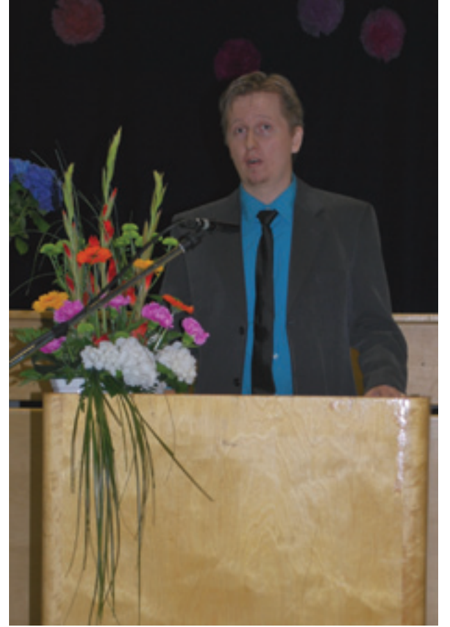
Rehtorin puhe kevätjuhlassa

Vaikka tällainen supersosiaalisuus saattaa aiheuttaa meille opettajille harmaita hiuksia, on