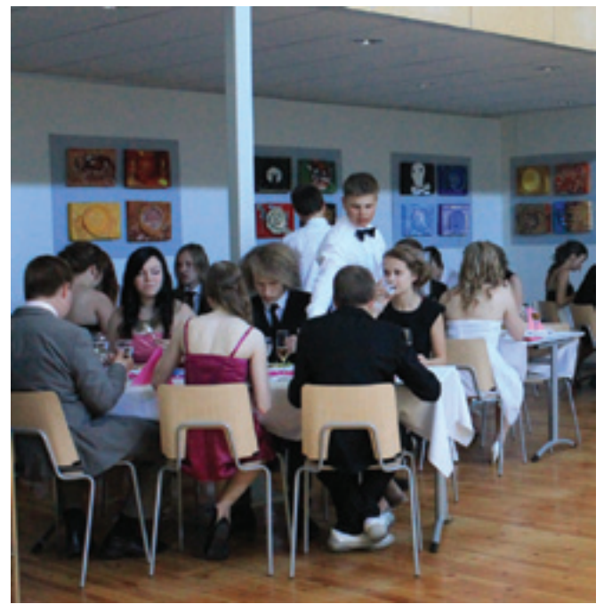
Ysiluokkien perinteinen Gaala tällä kertaa James Bond teemalla