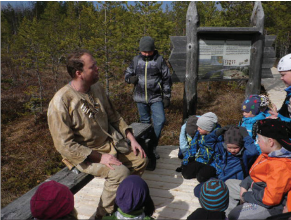
Kierikissä opas kertoi meille mielenkiintoisia asioita kivikaudesta.

Päivä oli kiva ja mielenkiintoinen, ja iltapäivällä kotiin tullessamme ihastelimme koruja, joita teimme itse. Päivä kului todella nopeasti.