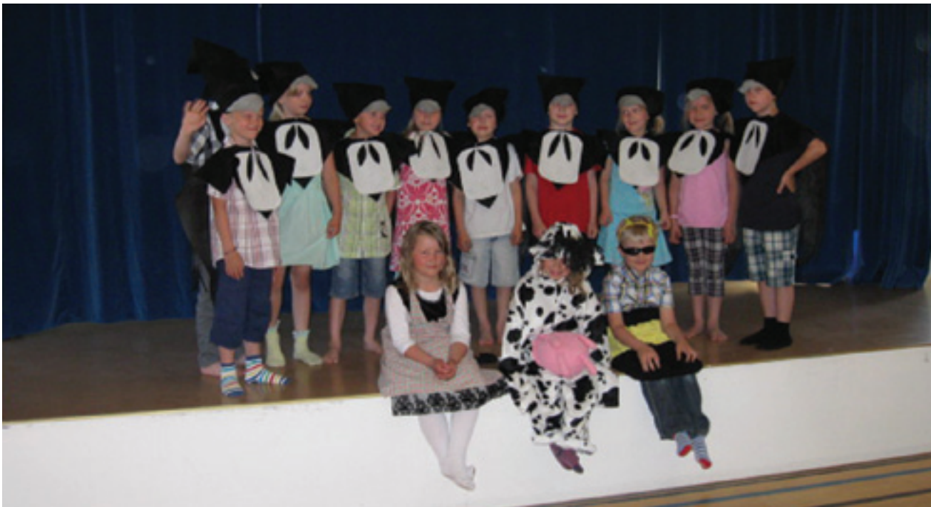
Eskarien kevätjuhlaesityksessä leikkivät sulassa sovussa harakat, lehmä, ampiainen ja piikatyttö.