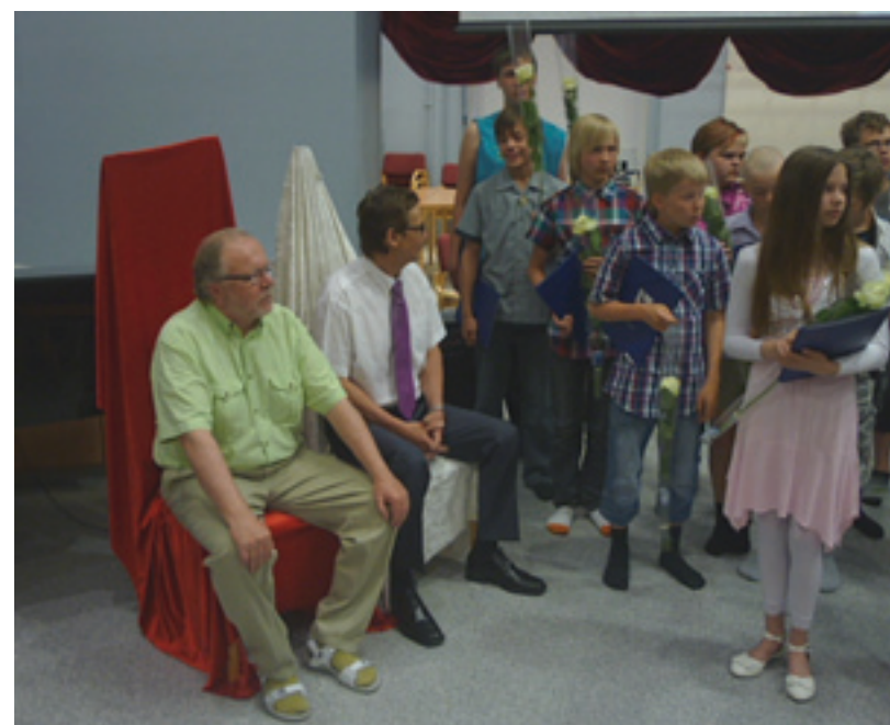
Nuorempia ja vanhempia koulun päättäjiä