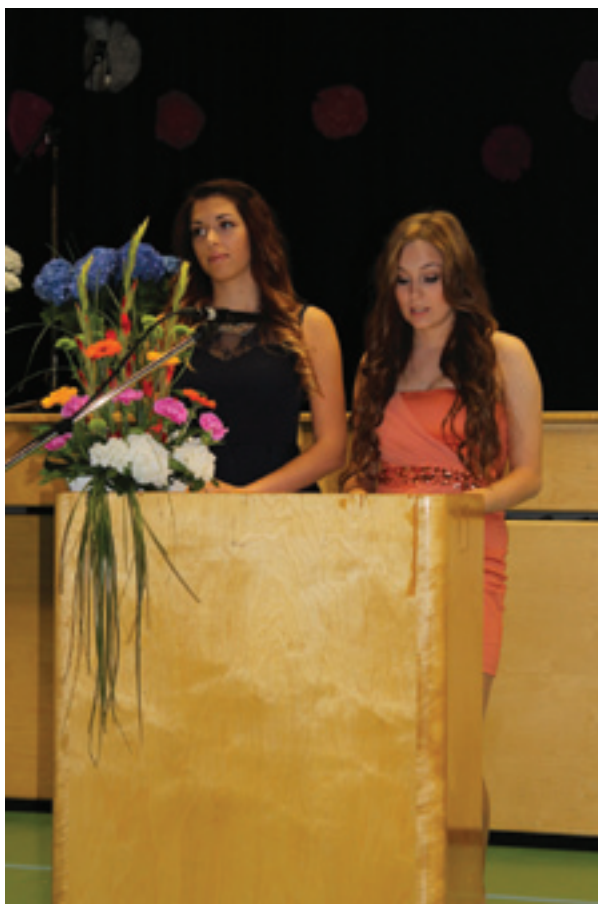
9. luokkalaisten puhe kevätjuhlassa