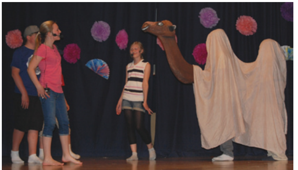
Suosittu alaluokkien kevätjuhla oli tänä vuonna nimeltään Taikurin kanssa maailmalla