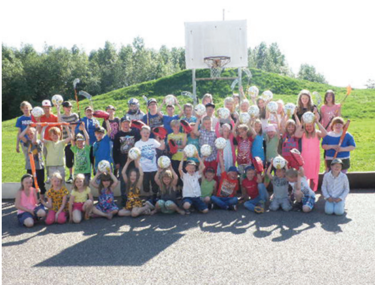
Koulu kiittää Pyhäjoen Lähivakuutusta liikuntavälinelajitoiminnasta.

Elokuussa tulee kuluneeksi tasan sata vuotta siitä, kun koulu aloitti toimintansa Parhalahden kylällä. Juhlavuosi huipentuu marraskuussa pidettäviin 100-vuotisjuhliin, joiden valmistelu alkaa syksyllä heti kouluvuoden alkaessa. Nykyinen jugend henkinen koulurakennus on rakennettu vuonna 1916 ja lähentelee siis itsekin arvokasta sadan vuoden ikää. Tämä historiaa henkivä kaunis koulurakennus on siis juhlansa ansainnut. Mutta sitä ennen nautimme täysin siemauksin kesästä ja karpäsistä. Haluan toivottaa hyvää ja aurinkoista kesää oppilaille, kodeille, henkilökunnalle sekä kaikille yhteistyökumppaneillemme.