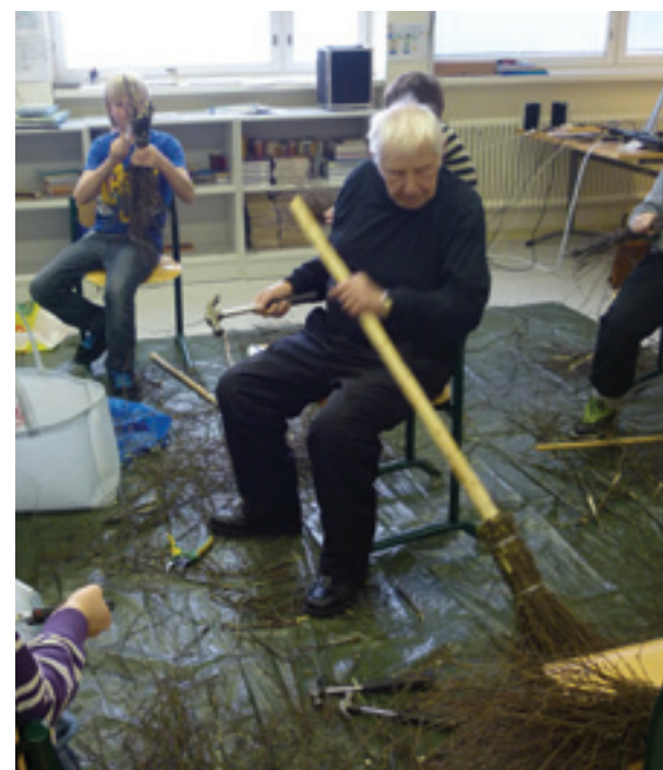
Koulun vuositeema rakentui kotiseudun ympärille. Kuva työpäivän luutarastilta

Puu joka ei ollut kukaan muu se ei ollut kukaan muu. Sillä oli suu ja jopa yksi luu! Niko 3.lk