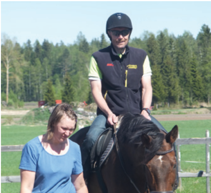
5-6.luokan kevätretkellä Peltolan tilalla Mehtäkylässä kaikki saivat ratsastaa.

Seuraavaksi menimme kylpylään uimaan. Kaikki tekivät voltteja hyppylaudoilla, minäkin. Kun oli uitu, lähes kaikki ostivat sokerista jäähilepirtelöä. Kukaan ei tykännyt siitä ja juomaa jaettiin toisille. Koululle päästessä monilla oli jo huono olo pirtelöstä, vaikka reissu olikin hyvä.