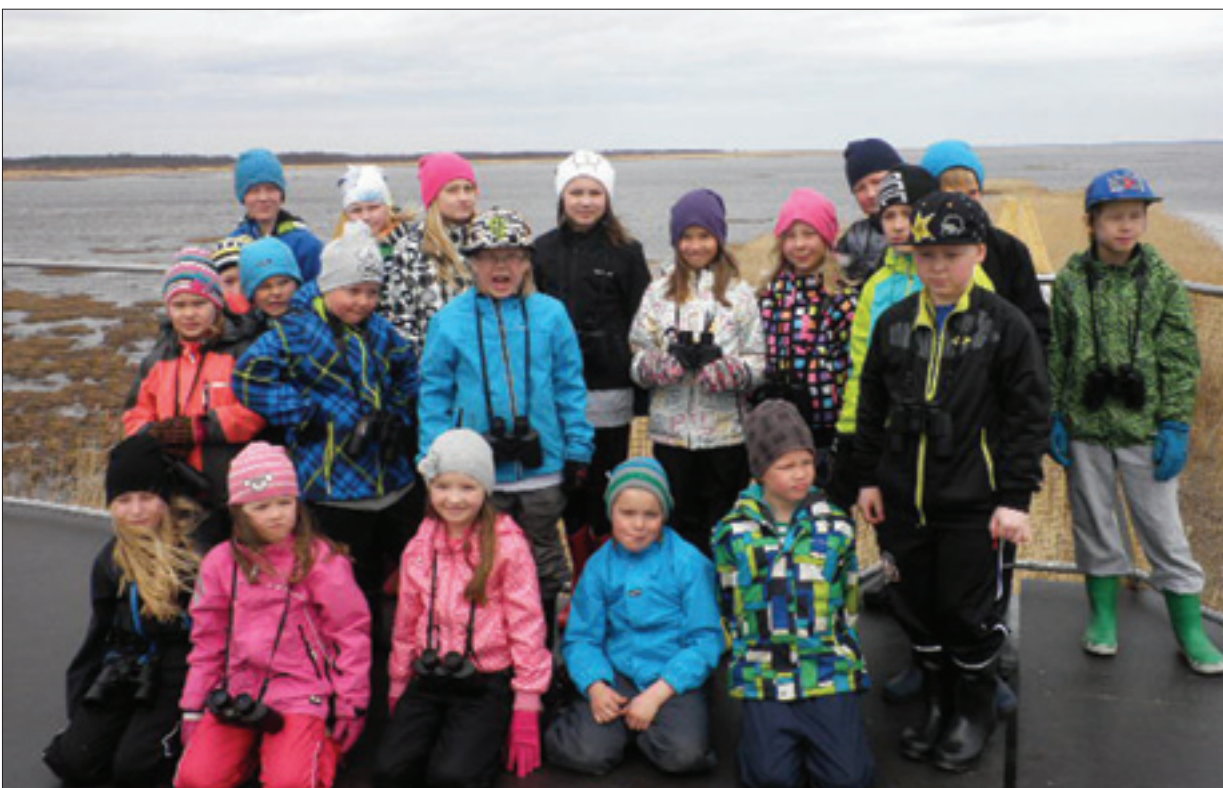
Linturetkeläisiä Liminganlahden lintutornilla.

kaukoputken avulla bongata laulujoutsenia, merikotkia, suokukkoja, liroja ja sorsia. Voimme lämpimästi suositella tätä retkikohdetta muillekin Pyhäjoen kouluille!