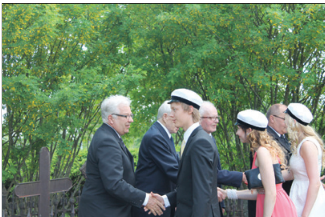
Ylioppilaiden vierailu sankarihautoilla päättyy aina samoin. Jokainen ylioppilas kiittää henkilökohtaisesti veteraaneja

Tämän uhrauksen edessä vähintään, mitä voimme tehdä, on pysähtyä hetkeksi. Pysähtyä hetkeksi muistamaan ja kiittämään sotiemme veteraaneja.