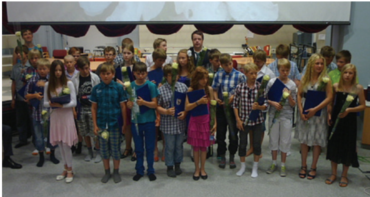
Kuutokset ja ysejä ruusuineen ja todistuksineen